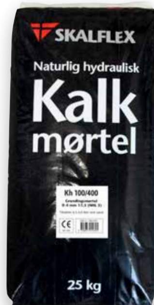
25 kg DB-nr. 1901551

Se sikkerhedsdatabladet, som forefindes på www.skalflex.dk for yderligere oplysninger.